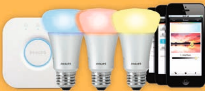
/ Philips Hue: slimme verlichting

Wilt u slimme apparatuur aanschaffen? Dan bent u vaak gebonden aan één merk, omdat de apparaten (vaak) alleen kunnen communiceren met andere apparaten van hetzelfde merk. Op deze pagina vindt u de bekendste voorbeelden, vaak te combineren met een app op uw smartphone.