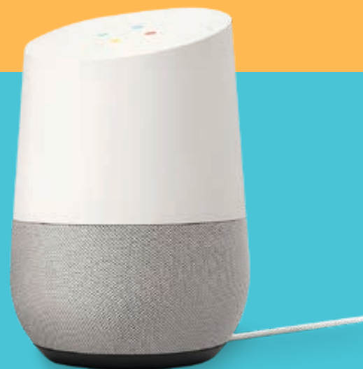
/ Google home: spraakassistent

Als aanvulling op de slimme apparaten zijn ook veel verschillende sensoren te koop. Deze kunt u in huis plaatsen om de apparatuur mee aan te sturen of gegevens mee te verzamelen. Zo kunt u via een spraakassistent met uw stem de verlichting dimmen en een speaker bedienen.