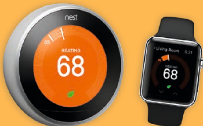
/ Nest: slimme thermostaat