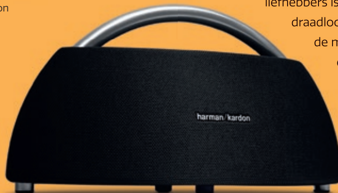
/ Harman Kardon Go Play

De bluetooth-speakers zijn vooral gemaakt voor gebruiksgemak en een goed geluid uit een relatief compacte luidspreker. Hoewel de boxen in het topsegment erg goed klinken, kunt u er geen echte hifi-ervaring van verwachten. Echte hifi-liefhebbers kunnen beter kiezen voor een 'bedraad' systeem zonder verlies van audiokwaliteit. Voor de 'gewone' liefhebbers is er keuze genoeg om een geschikt draadloos exemplaar te vinden. De prijs van de meest gangbare speakers ligt tussen de € 75,- en € 250,-.