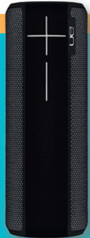
/ UE BOOM 2 Zwart

De kleine bluetooth-speakers geven vaak een groots geluid en hebben een interne accu waarmee ze gemiddeld 8 uur muziek kunnen afspelen. In tegenstelling tot wifi-speakers zoals die van Sonos, zijn de bluetooth-varianten volledig draadloos en niet afhankelijk van het thuisnetwerk. De muziek wordt meestal gestreamd via een bluetooth-verbinding met een smartphone of laptop. Daarnaast beschikken de meeste modellen over meerdere geluidsingangen zoals een aux- of USB-aansluiting. Heeft de speaker ook een ingebouwde microfoon? Dan kunt u deze gebruiken om handsfree gesprekken mee te voeren.