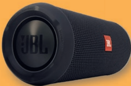
/ JBL Flip 3 Black Edition