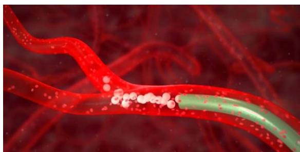
Figuur 2: Schematische afbeelding van het inspuiten van microspheres in een bloedvat