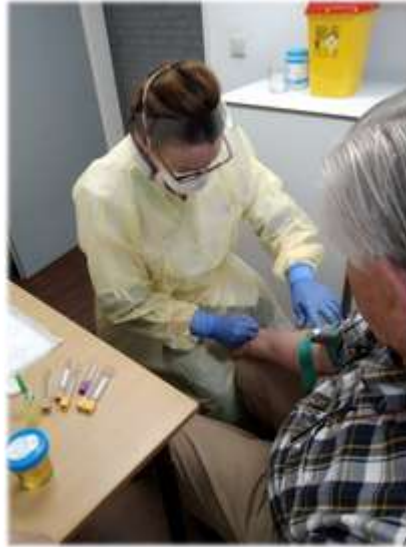
Afbeelding 4 Bloedprikken bij een coronapatiënt