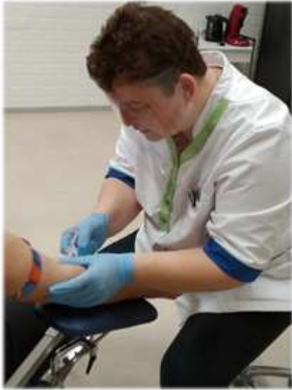
Afbeelding 3 Bloedprikken in coronatijd