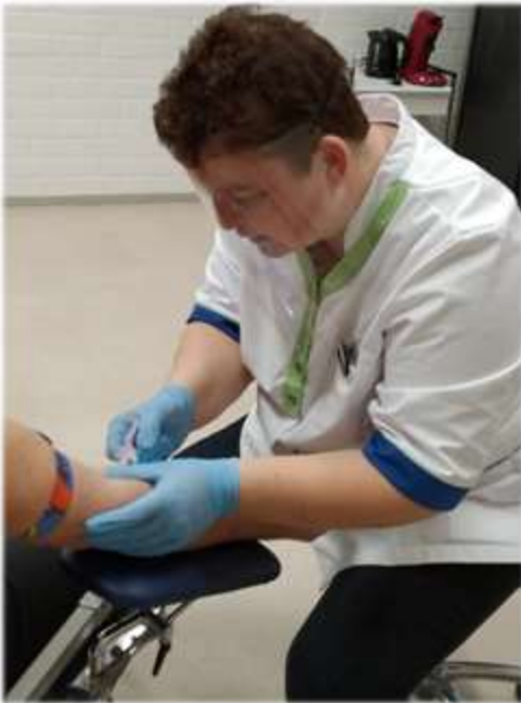
Afb. 3 Bloedprikken in coronatijd

< Afb. 2 Medewerker bloedafname met prik- en transportkoffer