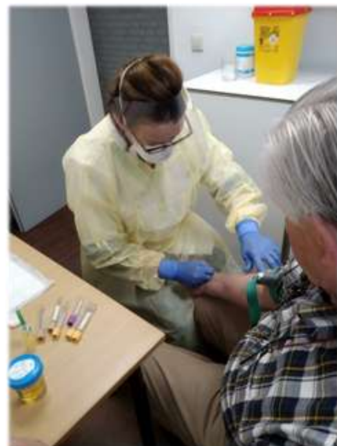
Afb. 4 Bloedprikken bij een coronapatiënt